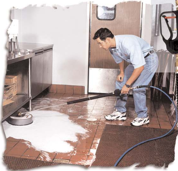
Aquí se observa el Hummer Jet Jr. con el ENJABONADO de baja presión opcional.

¿Todavía está utilizando la vieja fregona y la cubeta para limpiar sus pisos con resultados poco satisfactorios? Limpie sus pisos a presión con el Hummer Jet Jr.™ de SMT®. Está diseñado para ser utilizado con los sistemas de limpieza a presión de SMT. El Hummer Jet Jr. limpia con alta presión, con vara rotativa de alta velocidad y boquillas duales. El Hummer Jet Jr. limpia las impurezas de sus pisos y la suciedad acumulada que su fregona no limpia.