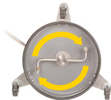
Ansicht der Unterseite Turborotationsarme mit Doppeldüsen nur ½" über der Oberfläche